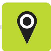
POINTS DE COLLECTE