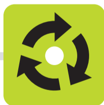
TRI ET RECYCLAGE