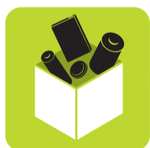
CUBE À PILES

➔ Dans une pile ou batterie, jusqu'à 80% DES MÉTAUX SONT RECYCLÉS pour être utiles au quotidien.